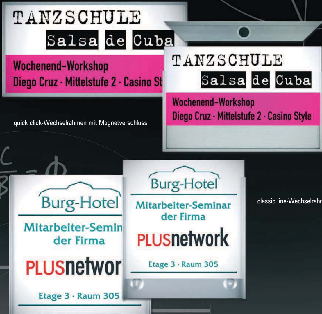
quick click-Wechselrahmen mit Magnetverschluss