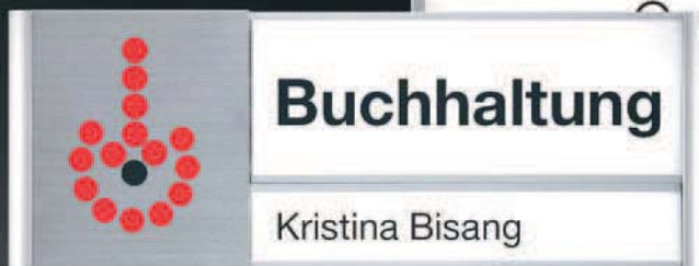
Selbstbeschriftung 21 und 42 mm, mit 1/4-Kreis Verschluss