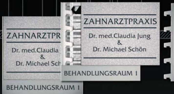
Schild im Granit-Look