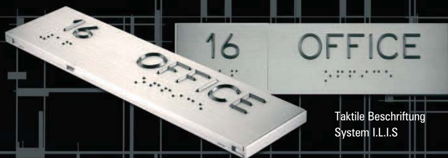
Taktile Beschriftung System I.L.I.S