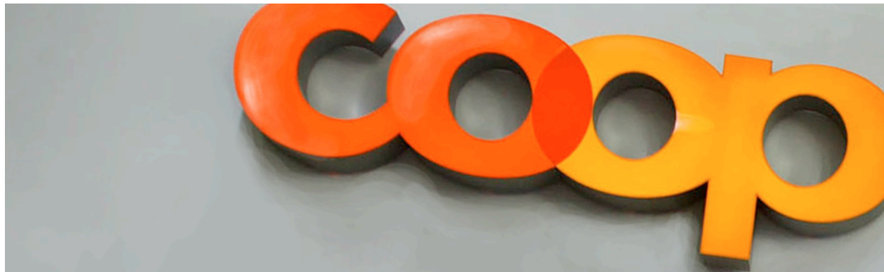
Projekt Coop Südpark